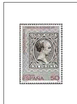
Centenario del Pelón 02/10/1989