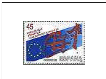
Presidencia Española 09/05/1989