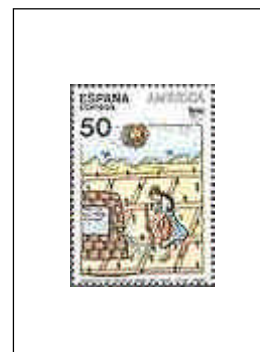
América - UPAE 07/11/1989