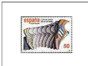
Copa del Mundo de Atletismo 01/09/1989