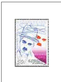
Charles Chaplin 19/09/1989