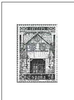
Casa del Cordón 22/04/1989