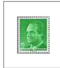
3004 T. Ilimitada