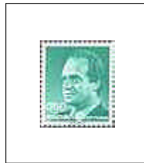
3002 T. Ilimitada