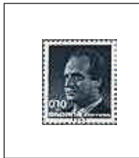
3001 T. Ilimitada