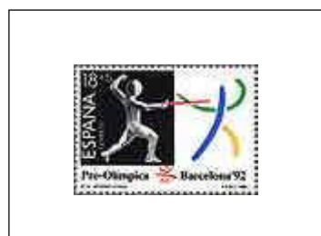
Barcelona '92 - III Serie Preolímpica 03/10/1989