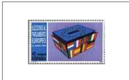
Elecciones al Parlamento Europeo 12/06/1989