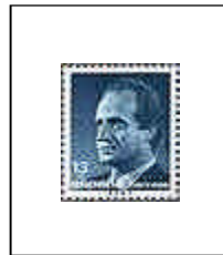
3003 T. Ilimitada