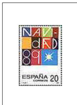
Navidad '89 29/11/1989