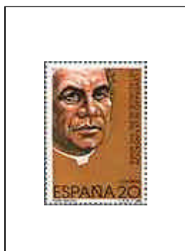
Escuelas del Ave María 13/10/1989