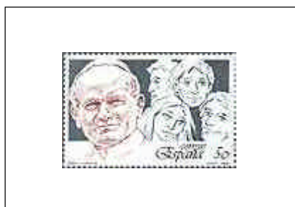
Papa y Juventud 19/08/1989