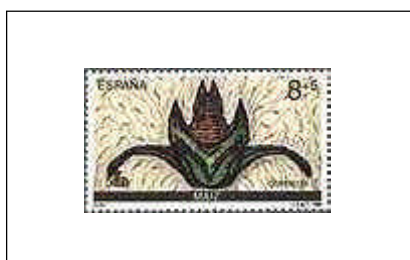
Vº centenario del Descubrimiento de América - Encuentro de dos Mundos 16/10/1989